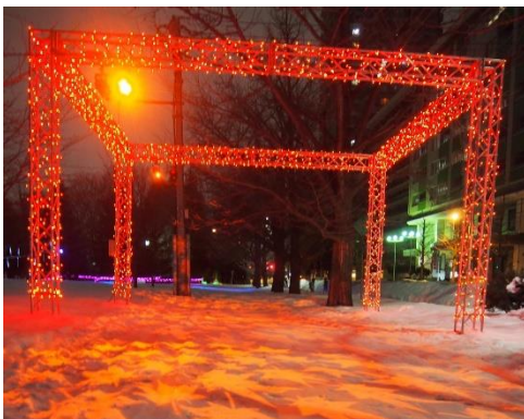
LED プレイライト(オレンジ)、Gobo ガラス(もみじ)