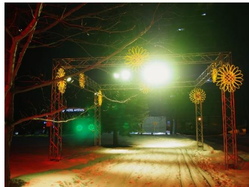
LED プレイライト(ラベンダー)