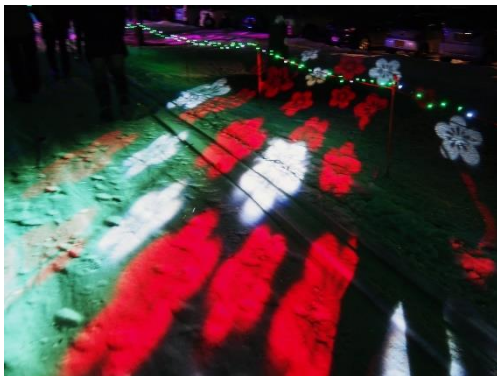
LED プレイライト(オレンジ)、Gobo ガラス(もみじ)